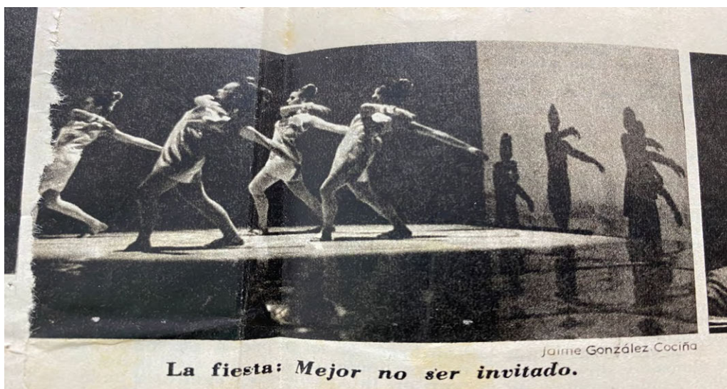
Imagen 8: La Fiesta mejor no ser invitado 1 de noviembre de 1966 Primera Plana Universidad Torcuato Di Tella. Archivo de la Biblioteca, Colección Serie prensa y difusión)