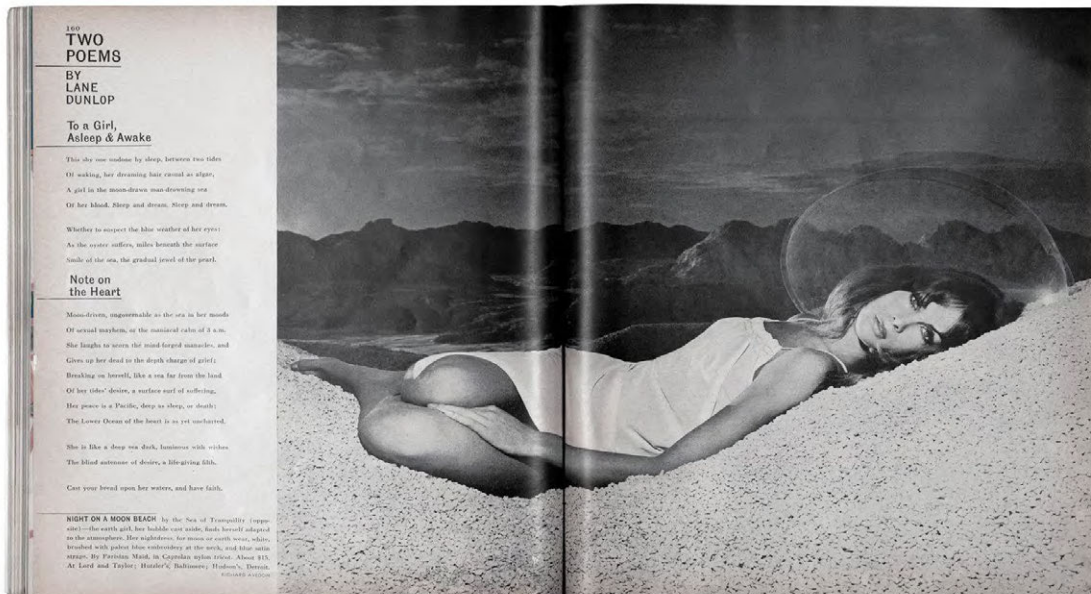
Imagen 3: Two Poems April 1965 Revista Harper's Bazaar