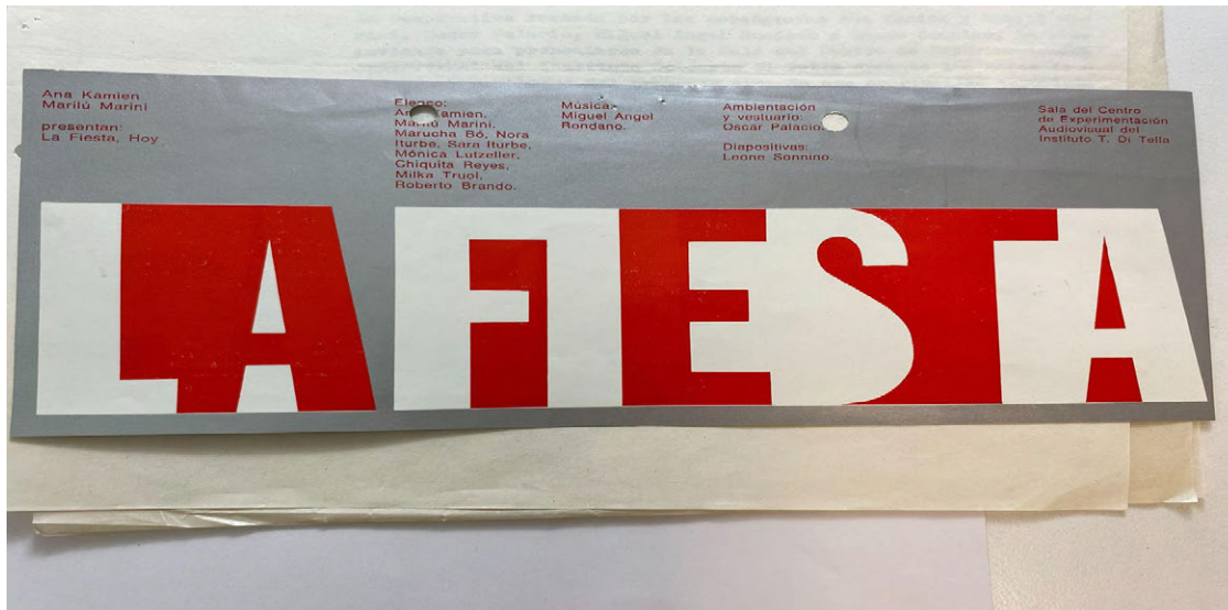
Imágen 2: Programa de mano anverso La Fiesta hoy Universidad Torcuato Di Tella.