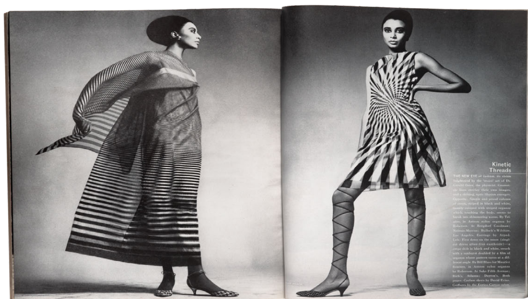
Imagen 9: Kinetic Threads April 1965 Revista Harpers Bazaar

De esta manera, podríamos interpretar que los procedimientos de repetición y redundancia, entre la parodia y la ironía, propios del por art, son reelaborados a partir de algunos principios compositivos del arte óptico-cinético. La coreografía se puede leer como una ambientación-acción gracias a la relación estructural de los elementos entre poses, gestos y música en la totalidad del ambiente, para generar un cinetismo en la percepción de lxs espectadorxs. Pero este cinetismo está abordado desde un aspecto conceptual de la sensación de movimiento, más que sensorial.