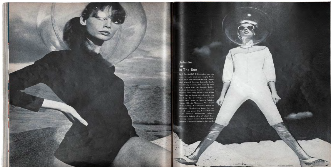
Imagen 4 : Galactic Girl April 1965 Revista Harper's Bazaar