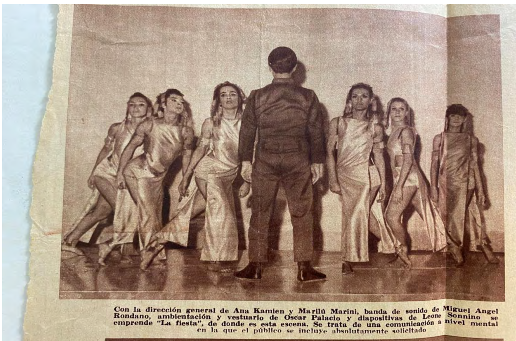
Imagen 7: Un nuevo olor a experiencia s/f La Nación Universidad Torcuato Di Tella. Archivo de la Biblioteca, Colección Serie prensa y difusión

Podemos analizar, gracias a las fotografías de la obra, las referencias críticas y las entrevistas, cómo el diseño coreográfico entre movimientos estáticos y poses repetitivas fue elaborado en base a los comportamientos y gestualidades de las revistas de moda. Rastreamos en varias ediciones de la Revista Vogue la analogía de estas gestualidades y las posiciones de los cuerpos, tanto en sus posturas de perfil como en las formas geométricas.