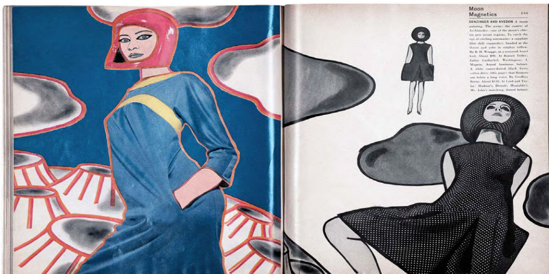
Imagen 5: Moon Magnetics April 1965 Revista Harper's Bazaar